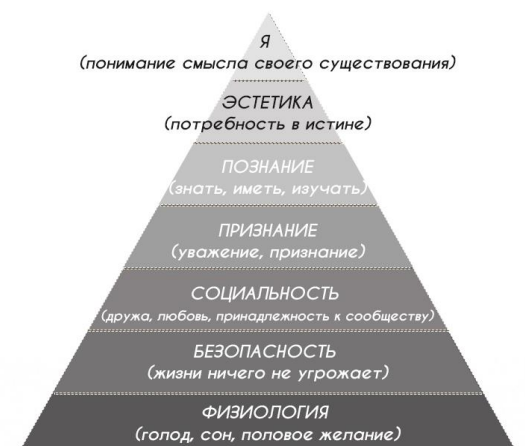
7-УРОВНЕВАЯ ПИРАМИДА МАСЛОУ ВРОЖДЕННЫЕ ПОТРЕБНОСТИ

Желание быть «чем-то бóльшим» заставило меня пойти на риск и опробовать на практике предложенную Достоевским инструкцию. Было заявлено, что «просветление» гарантировано точно. Далее я подробно опишу все изменения, произошедшие со мной за те адские три дня, пользуясь выдержками из собственного дневника.